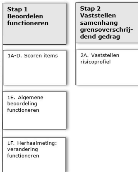
Figuur 1. Schematische weergave scoringsprocedure

Voor meer informatie zie Handleiding p19 - 21